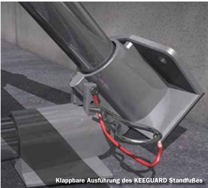
Klappbare Ausführung des KEEGUARD Standfußes